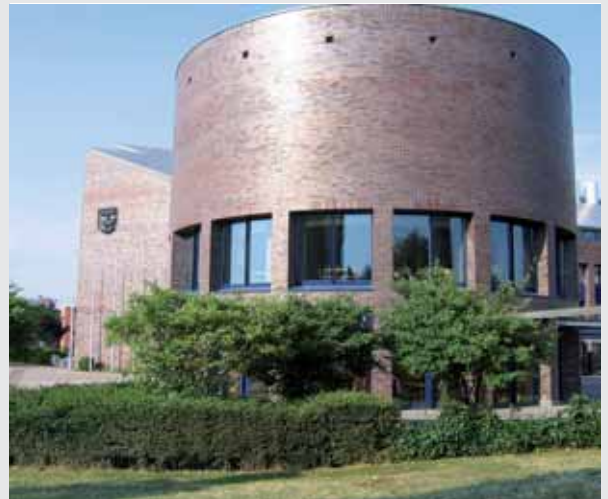
· Ratssaal – Sitz der Gemeindevertretung