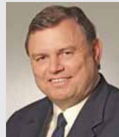
Volker Dornquast (Bürgermeister)